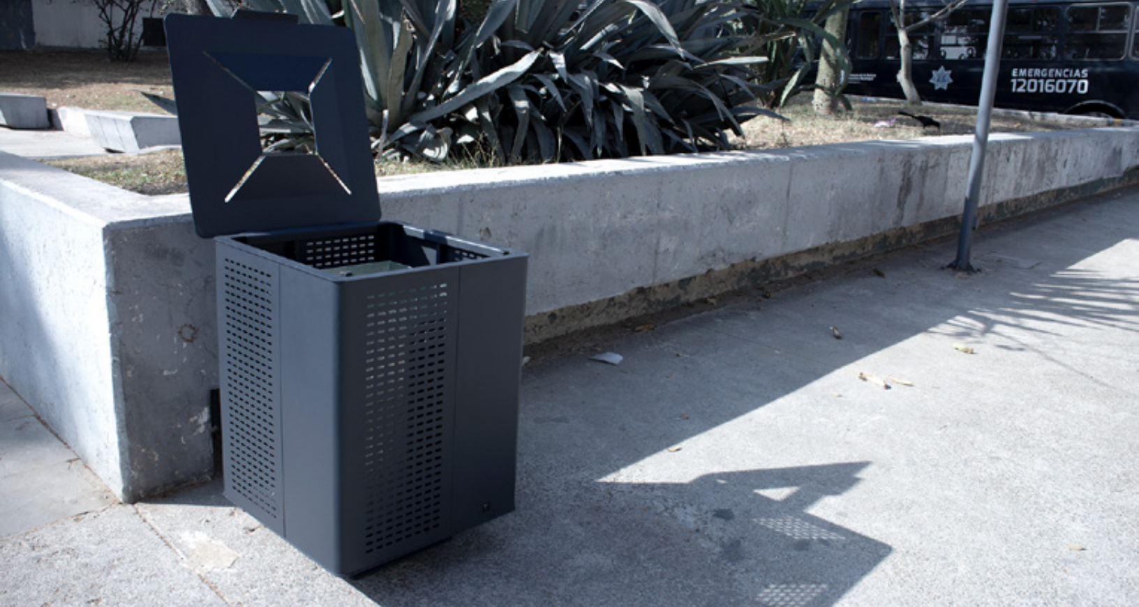
Basurero /Litter bin · BA-007